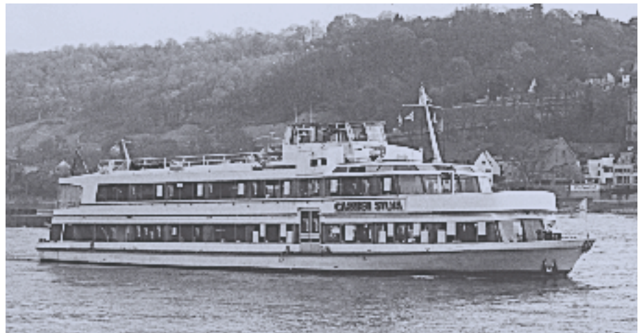
Am 27. September heißt es: Bitte Platz nehmen an der Schwimmenden Kaffeetafel an Bord der Carmen Sylva.