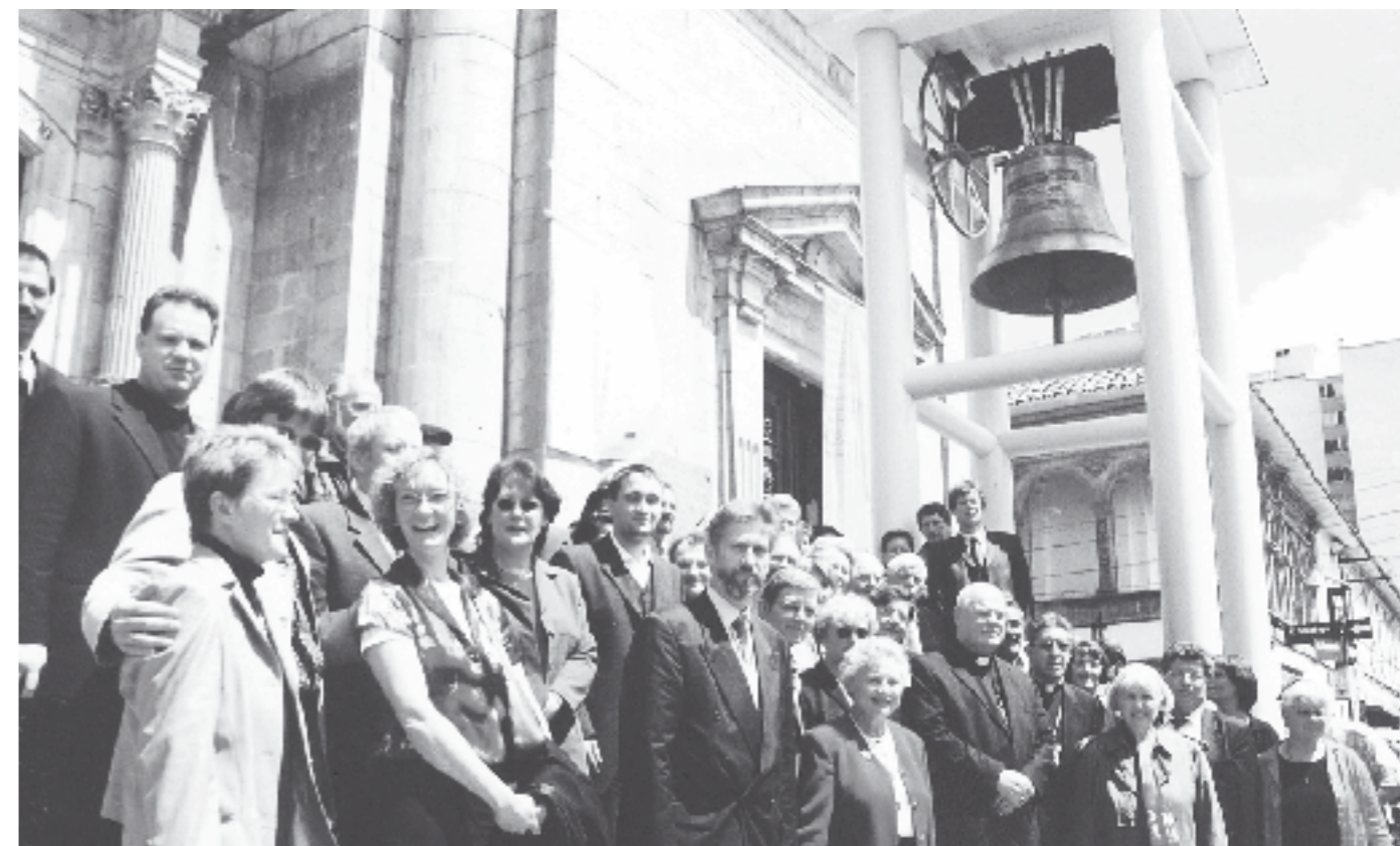
Einsatz für den Partner in Bolivien: Die Trier Bistumsdelegation zu Besuch in La Paz.

Als vor fünf Jahren in Trier die Unterstüt-