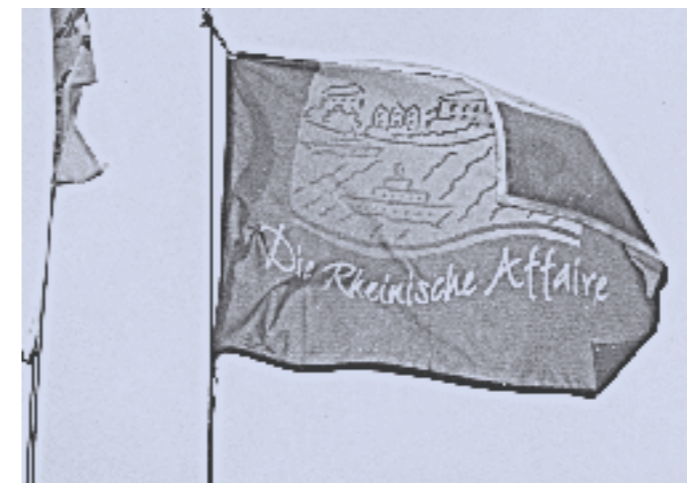
Der Kaffee zeigt Flagge: Groß und Klein kamen am 5. April an Bord, um mehr über die Affairenkaffees zu erfahren.

ELAN bot insbesondere für Kinder und Jugendliche den Kaffeeparcours an: eine Info- und Mitmachstation für Hintergrundwissen rund um Kaffeeproduktion und Vertrieb. Der Parcours kann übrigens beim gmö Mittelrhein-Lahn ausgeliehen werden (Tel.: 02631/987036).