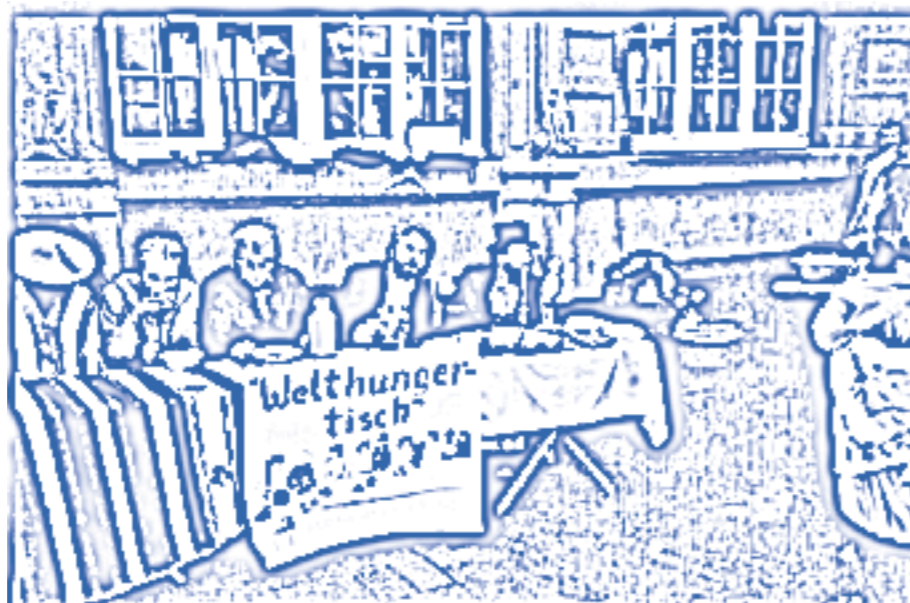
Mit symbolischen Aktionen wie einem Welthungertisch wollen die Mitglieder der Aktion 3% auf Ungerechtigkeiten aufmerksam machen.

Inhaltliche Schwerpunkte sind neben der Projektarbeit die Informationsweitergabe zu den Entwicklungen in Bolivien und Nicaragua. Darüber hinaus arbeitet die Aktion 3% in der Antiminenkampagne und