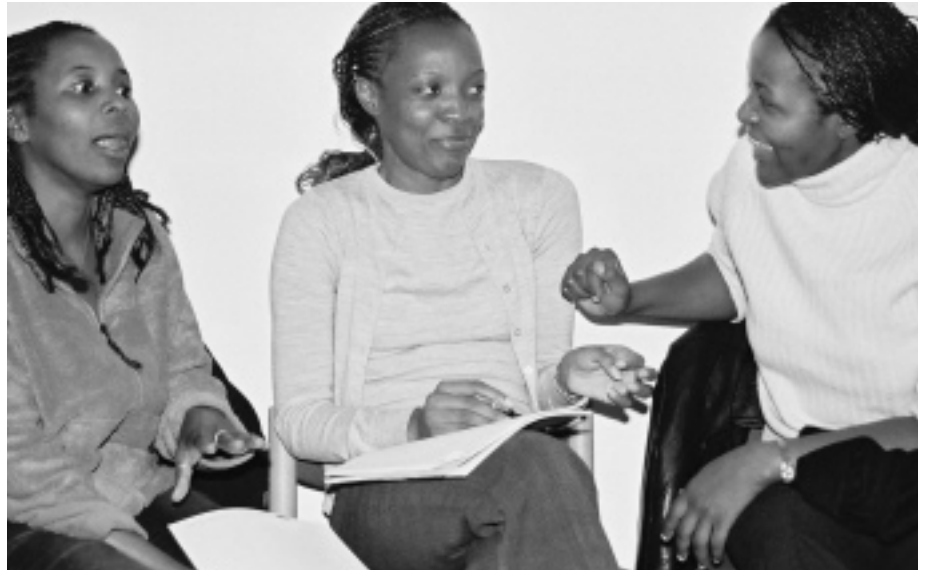
Auf dem Studienseminar am 12. Oktober 2002 zum Thema: „Patente, Profite und Aids“

Um dieser Situation zu begegnen bietet STUBE Rheinland-Pfalz/Saarland fünf Bausteine in ihrer Arbeit an. In Orientierungsveranstaltungen bereiten sich die Studierenden am Anfang ihres Studiums auf die Arbeitstechniken an Hochschulen und das Leben in Deutschland vor. In Fachveranstaltungen