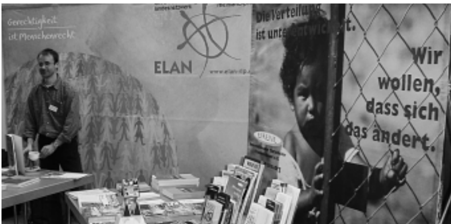
Auf dem Kongress „(M)Eine Welt – Globales Lernen“ in Trier